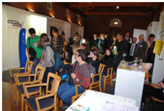
MEVFFSZ 2010. kiállítás