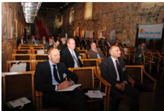
MEVFFSZ 2010. konferencia

Reklámügynökségünk jelentős tapasztalatokkal rendelkezik kiállítások, konferenciák szervezésében. Ha cége kiállítási részvételét tervezi, keressen minket bizalommal! A stand bérlésétől az arculat kialakításán keresztül, a lebonyolításig mindent ránk bízhat!