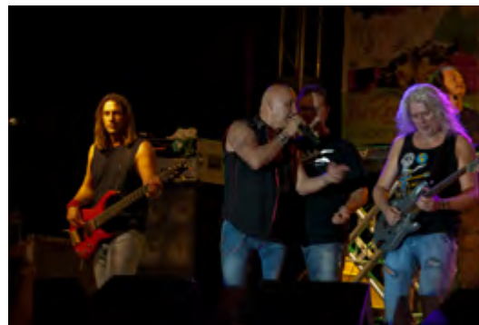
EDDA Művek Turné 2011.