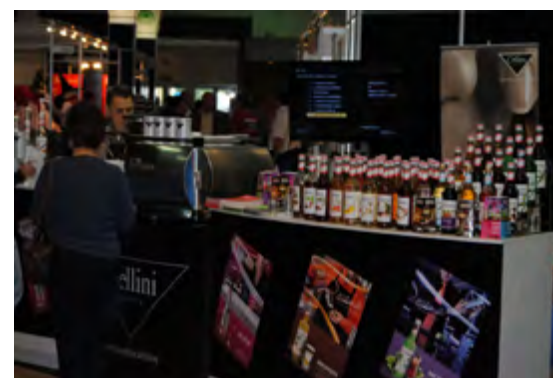
HOVENTA 2011. Pannaco Kft. - Vértés Food Kft.