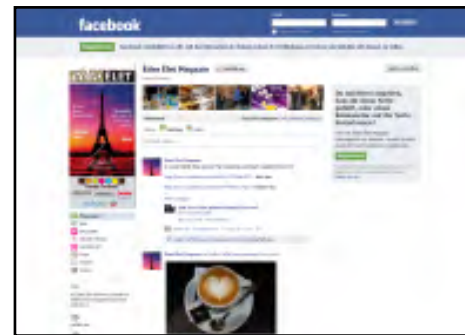
édes élet magazin facebook oldala