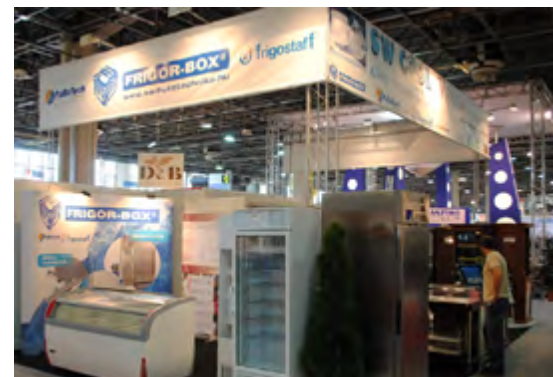
HOVENTA 2010. SW-Cool Kft.