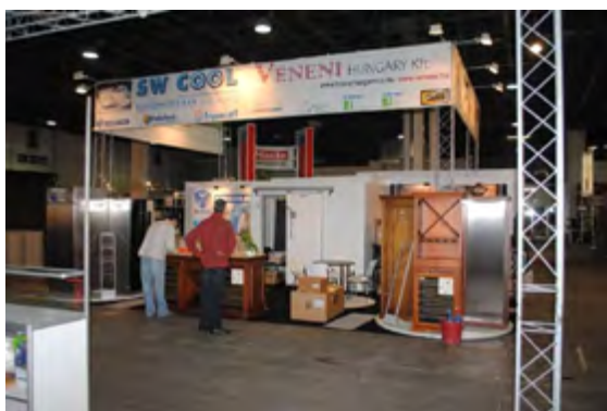
HOVENTA 2010. standépítés