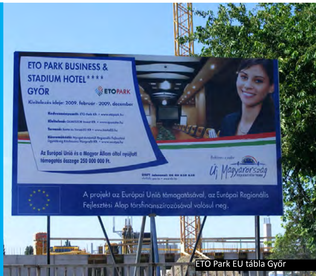
ETO Park EU tábla Győr

Munkamódszerünk több lépésből áll. Az új ügyfelekkel történő első találkozás alkalmával kíváncsiak vagyunk arra, hogy a vállalkozás az idáig milyen eredményeket ért el és mik a jövőbeni céljai. Nagyon fontos, hogy az ügyfélnek legyen elképzelése, hiszen a reklám egy eszköz a célok eléréséhez. A célok meghatározását követően javaslatot teszünk a szükséges lépésekre, megalkotjuk koncepciónkat és prezentáljuk azt. A tényleges munkafolyamatot folyamatos hatékonysági vizsgálatok mentén végezzük.