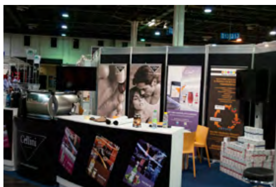
HOVENTA 2011. standépítés